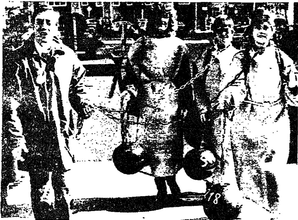
ارتدت ثلاث نساء من المنيا الاتحادية ملابس السجيات وحملن كرات حديدية ورحن يتظاهرن في ٢٥ الجري ضد مضمون البند رقم ٢١٨ المتعلق بالاجهاض ميونخ.